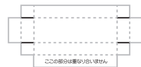
③の重ね合わせた状態