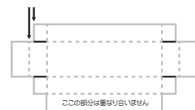
③の重ね合わせた状態